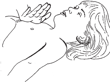
Técnica de una mano